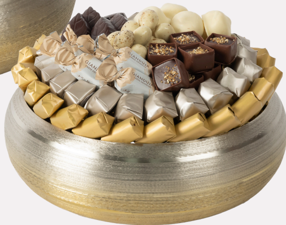
Ref0041 Coupe ronde métal brossé PM Ø = 25 cm H = 9 cm 1250 g - 1 600 MAD