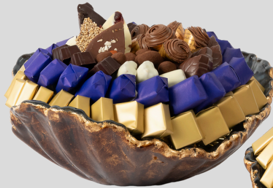
Ref0048 Murano gold blue MM Ø = 30 cm H = 11 cm 1000 g - 1 580 MAD