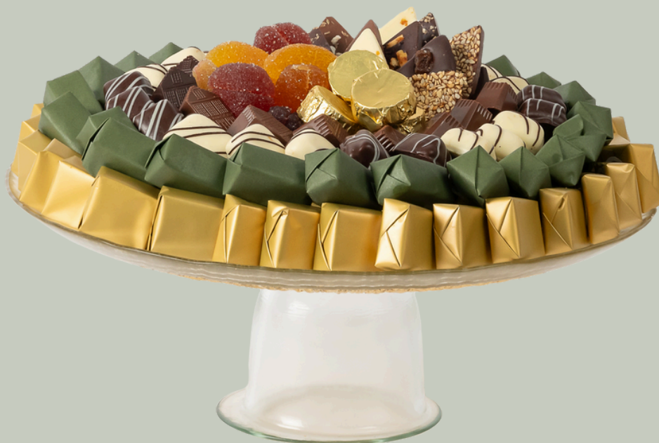
Ref0015 Plat à tarte en verre PM Ø = 28 cm H = 10 cm 1100 g - 1 380 MAD