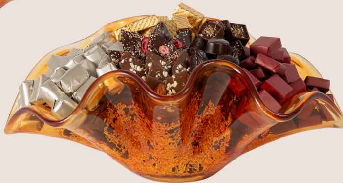
Ref0021 Coupe Murano L= 44 cm l= 29 cm H= 16 cm 2000 g - 2 850 MAD