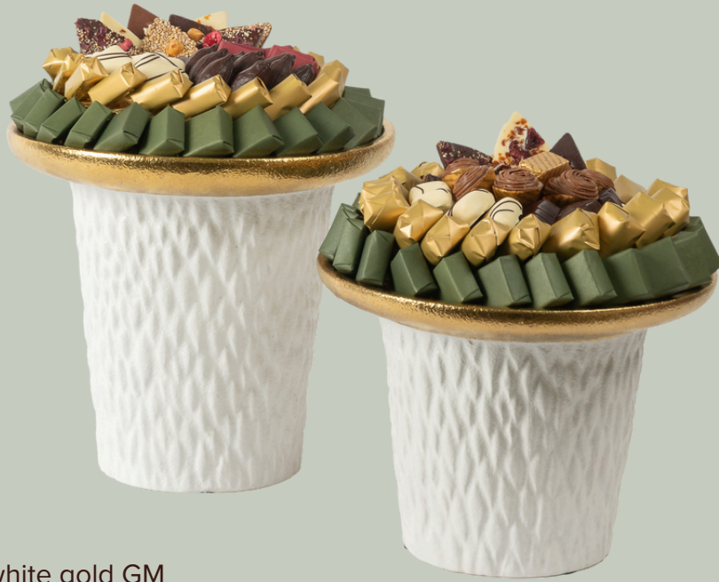
Ref0006 Céramique white gold GM Ø = 26 cm H=24 cm 950 g - 1480 MAD