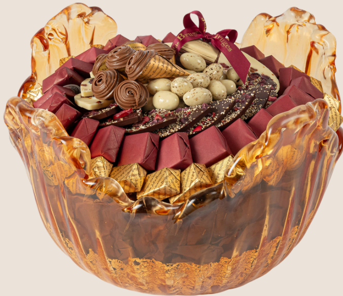
Ref0027 Corbeille Murano MM Ø = 32 cm H = 20 cm 2000 g - 2 680 MAD