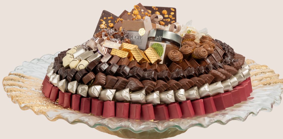
Ref0022 Centre de table Murano PM Ø = 44 cm H= 12 cm 2000 g - 2 880 MAD