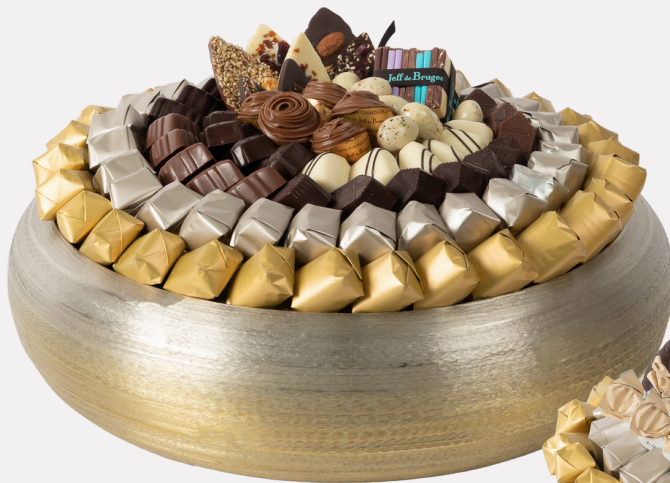
Ref0040 Coupe ronde métal brossé GM Ø = 30 cm H = 11 cm 1750 g - 2 300 MAD