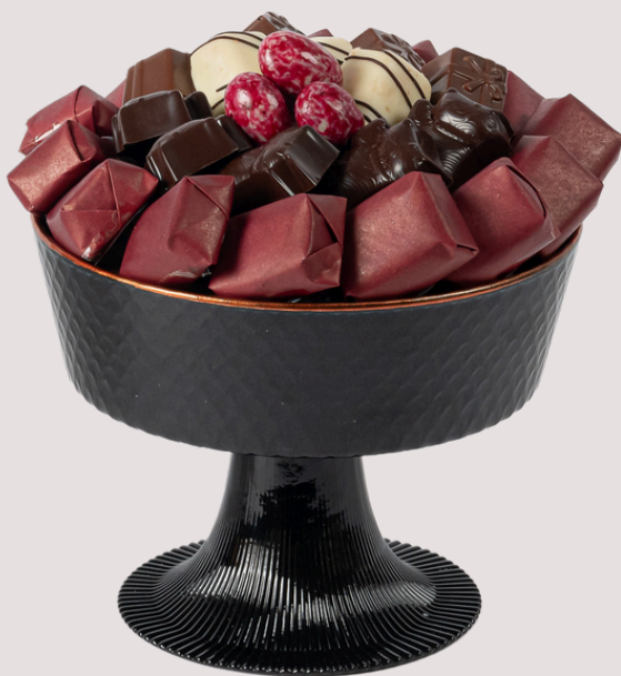
Ref0051 Coupe noire mate GM Ø = 21 cm H = 17 cm 750 g - 980 MAD