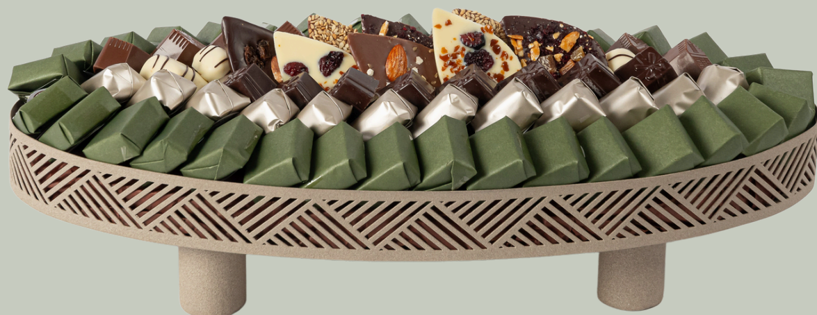
Ref0010 Plateau Piassetti PM L = 50 cm l = 25 cm H = 8 cm 1800 g - 2 650 MAD