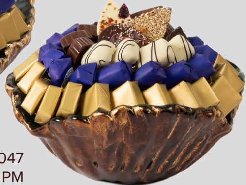
Ref0047 Murano gold blue PM Ø = 23 cm H = 10 cm 550 g - 980 MAD