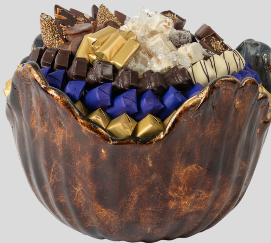
Ref0049 Corbeille Murano gold blue Ø = 30 cm H = 20 cm 2000 g - 2 680 MAD