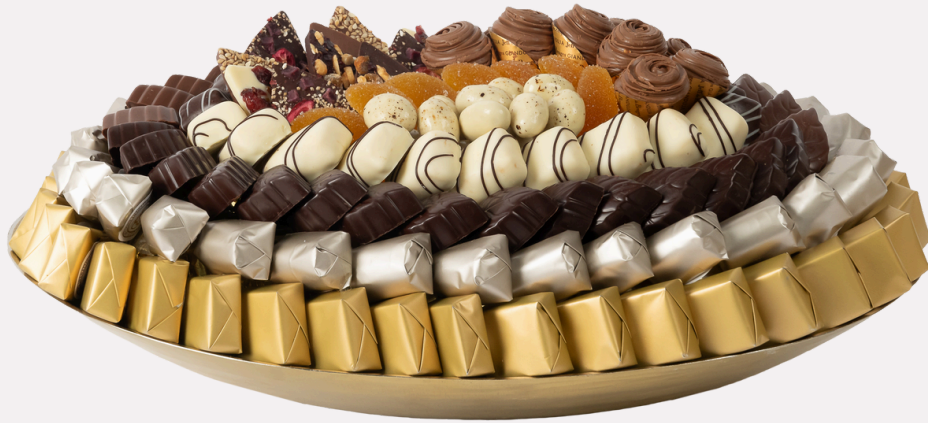
Ref0038 Coupe ovale métal brossé PM L= 38 cm l = 28 cm H = 5 cm 1800 g - 1 980 MAD