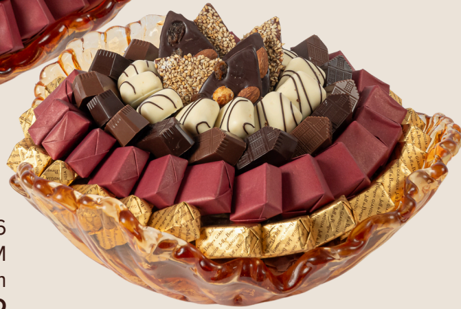
Ref0026 Corbeille Murano PM Ø = 28 cm H = 20 cm 1000 g - 1 580 MAD