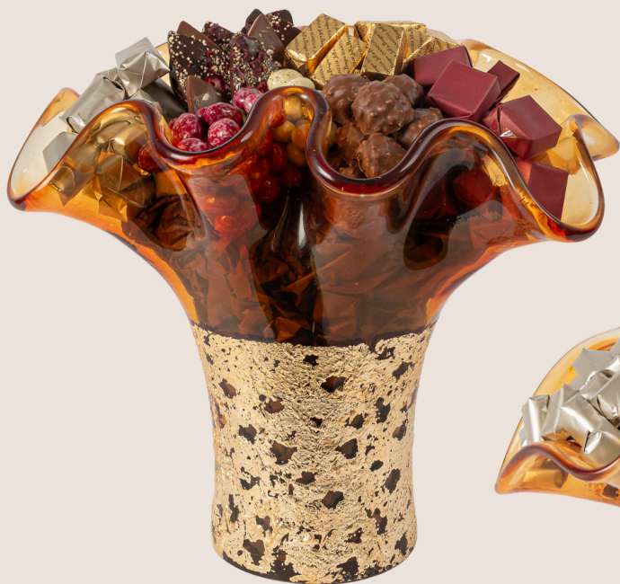
Ref0020 Vase Murano L= 29 cm l= 23 cm H= 30 cm 1150 g - 1 750 MAD