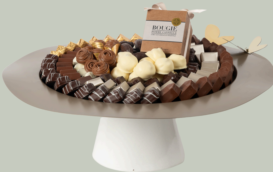
Ref0014 Coupe galvanisée papillon Ø = 48 cm H = 16 cm 1500 g - 2 790 MAD