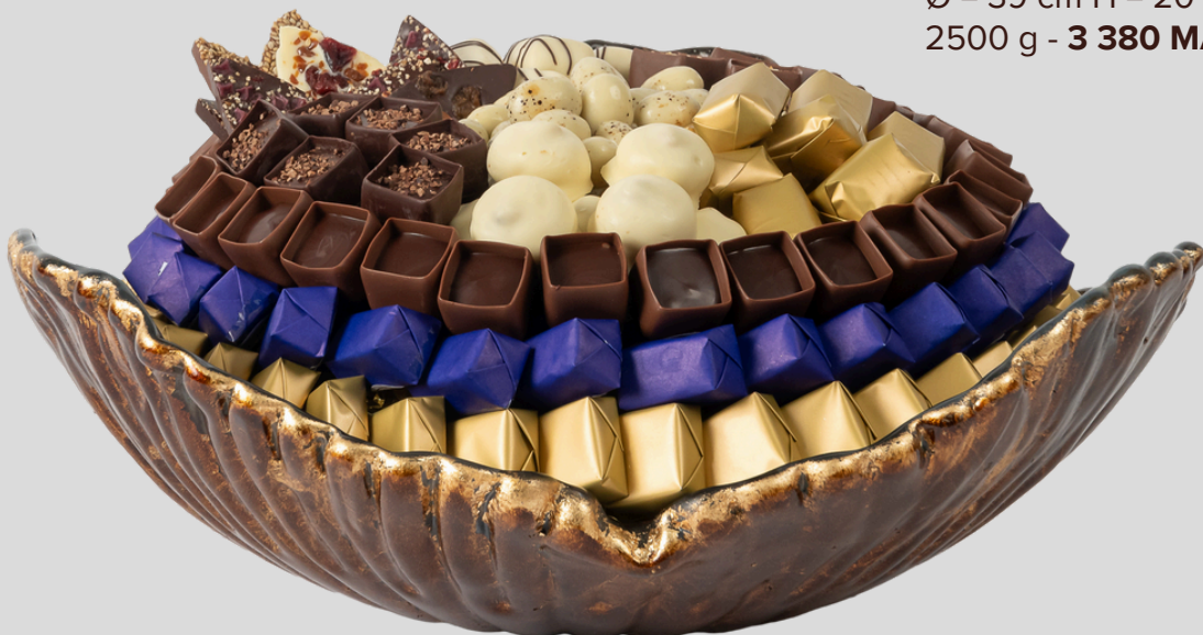
Ref0050 Murano gold blue GM Ø = 39 cm H = 20 cm 2500 g - 3 380 MAD