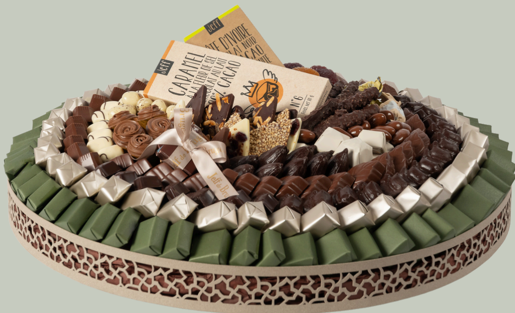
Ref0009 Plateau rond galvanise Piassetti PM Ø = 40 cm H = 8 cm 1800 g - 2 750 MAD