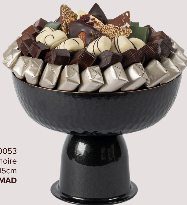
Ref0053 Coupe sur pied noire Ø = 21 cm H = 15 cm 750 g - 980 MAD